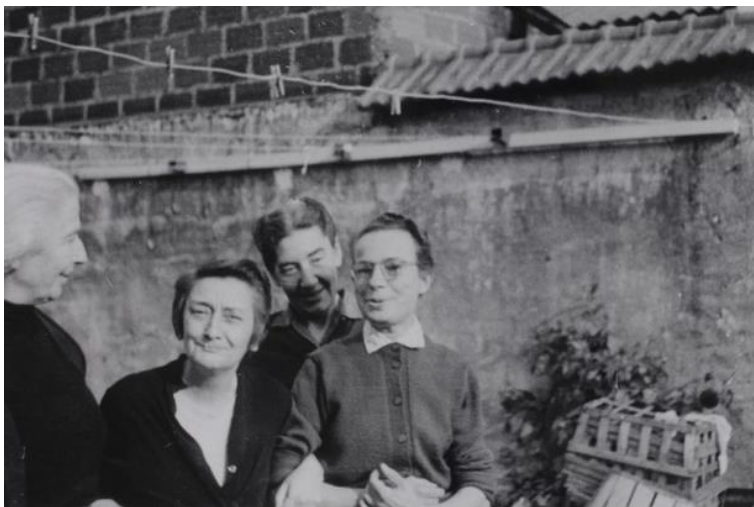
Figure de foi

Madeleine Delbrêl s'installe à Ivry-sur-Seine en 1933. Après des débuts littéraires brillants, elle devient assistante sociale jusqu'en 1945 puis se consacre pleinement aux autres et à la réinsertion des personnes dans la misère sous toutes ses formes. A partir de 1935, avec les femmes de son groupe dénommé « La Charité », elles s'installent au cœur de la ville, au 11 rue Raspail, où toutes sortes de personnes sont accueillies, écoutées, aidées et parfois logées. Elles offrent aux habitants de la ville un visage de fraternité et de bonté qui, aujourd'hui encore, fait vivre cette maison rénovée et réhabilitée.